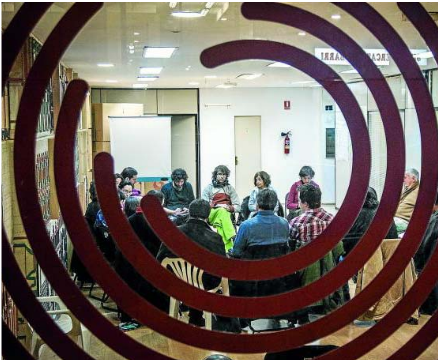
Reunión de Barcelona en Común, plataforma ciudadana liderada por Ada Colau que aspira a gobernar en la Ciudad Condal.