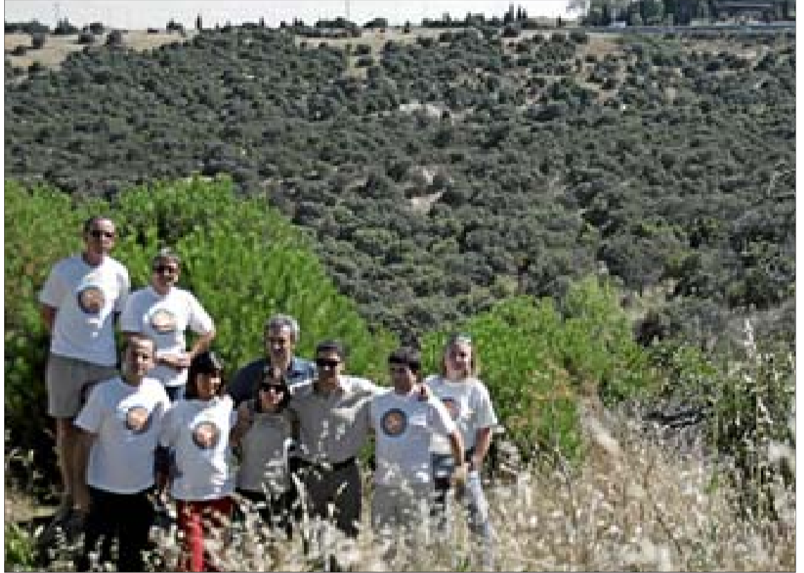
Varios de los miembros de la formación política Vecinos por Torreldones en el Área Homogénea Norte.

Los Vecinos por Torreldones entienden que «no hay ninguna razón objetiva» para cambiar la calificación del territorio. «El valor medioambiental no es opinable», dijeron varios de sus miembros. Por eso, sospechan de la existencia de intereses ocultos entre los propietarios de los terrenos y el Ayuntamiento. «¿O acaso a alguien se le ocurriría dudar del indiscutible va-