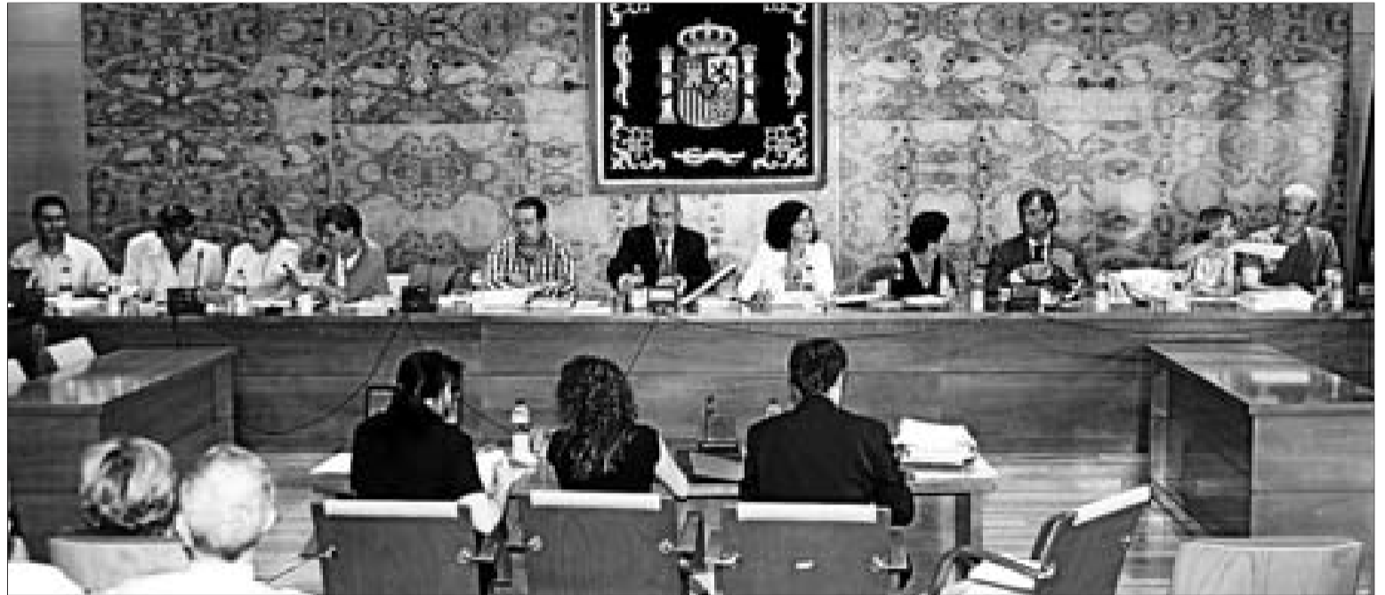
Imagen del pleno celebrado ayer por la tarde en el Ayuntamiento de Torrelodones.