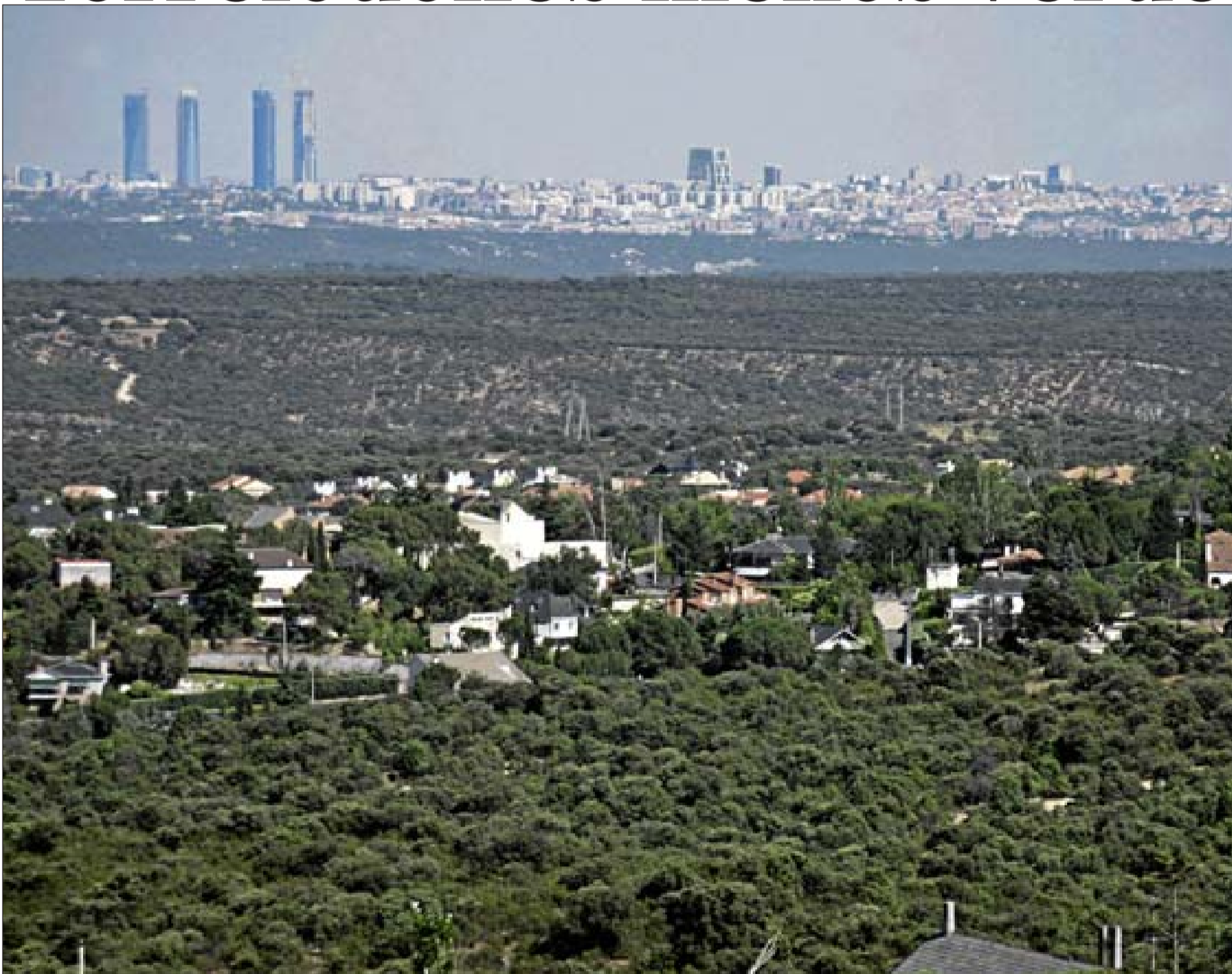
Imagen del Área Homogénea Norte, que, según 'Vecinos por Torrelodones', supondrá la desprotección de 130 hectáreas de terreno no urbanizable para hacer casas, un campo de golf y un parque empresarial.

El Ayuntamiento de la localidad, con mayoría absoluta del PP, dio ayer el primer paso para desclasificar 130 hectáreas de suelo / 2-3